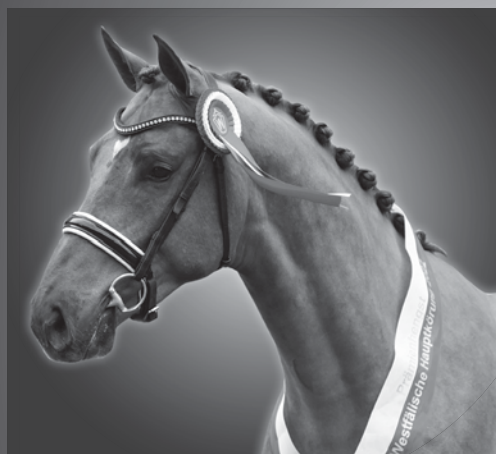
CONSANTOS CONTHARGOS - ZAVALL VDL