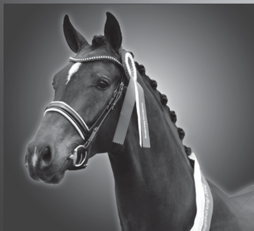
FORTUNIO FOR ROMANCE II - ZACK