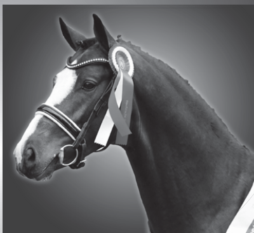
GLOBAL DANCER GLOBAL PLAYER - CLINTINO